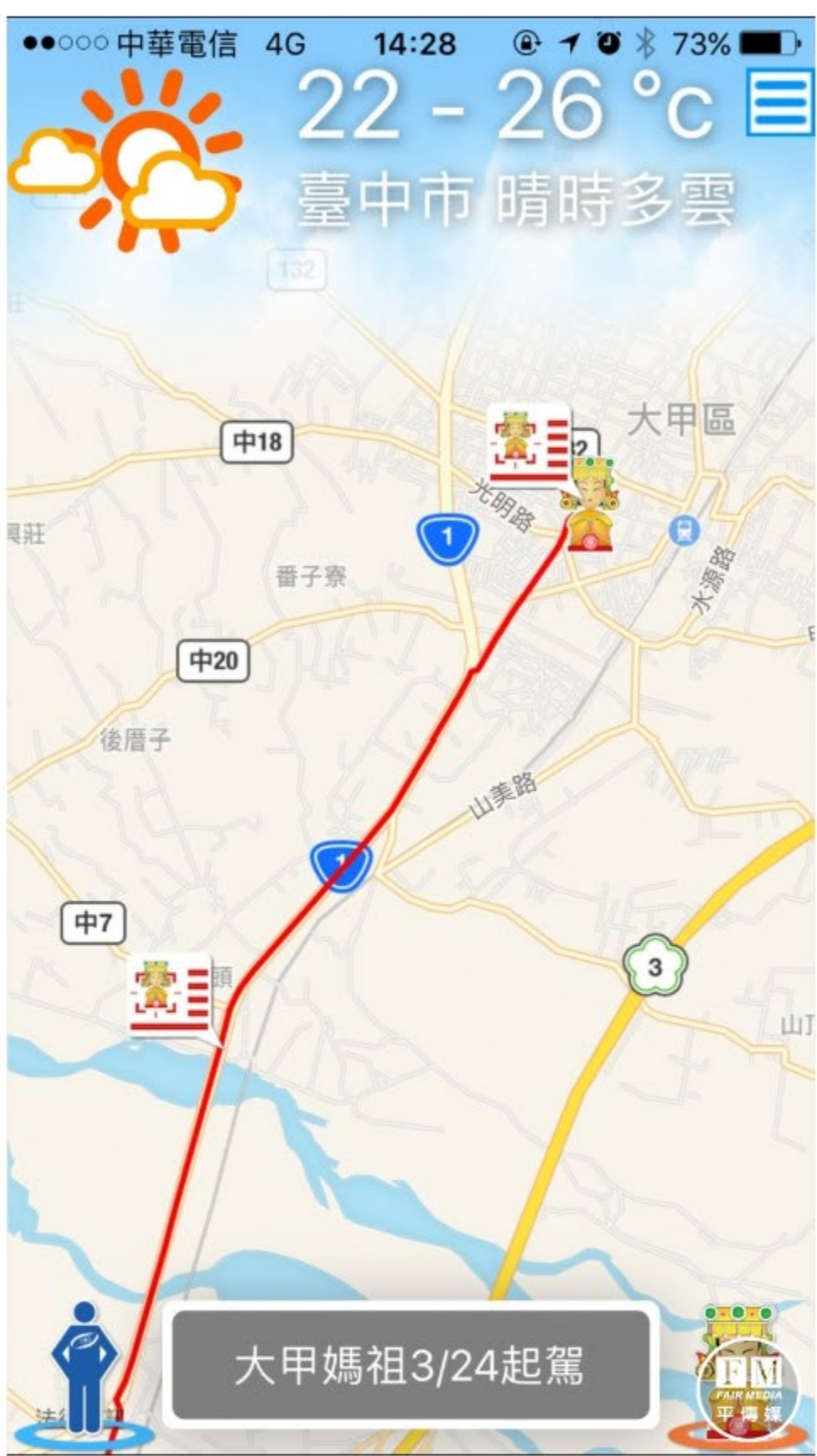
「大甲媽祖」App幫助民眾查詢媽祖鑾轎的即時位置。

【記者廖珮翎／台中報導】世界三大宗教慶典之一的大甲鎮瀾宮「大甲鎮瀾宮天上聖母遶境進香」24日晚上11時展開，為期9天8夜。逢甲大學團隊連續12年公益贊助，建置「天上聖母遶境進香衛星定位服務網」及「大甲媽祖」App，提供媽祖鑾轎衛星定位、即時影像及鎮瀾宮現場Live直播服務、查詢遶境進香路線資訊，包含預計抵達時間、地點，方便無法全程參與的信徒，可配合媽祖鑾轎的即時位置資訊，輕鬆規劃跟轎行程。今年下載「大甲媽祖」App，不但可領平安符、抽周邊商品，還可使用新功能蒐集公仔，並與Q版媽祖合照。