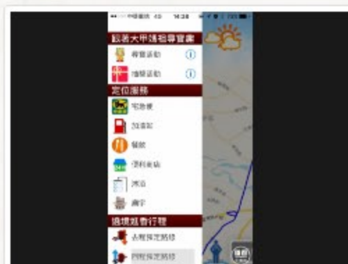
「大甲媽祖」App提供資訊查詢及尋寶活動。