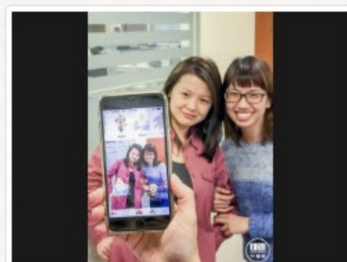
今年新增與大甲媽App公仔合照的功能。